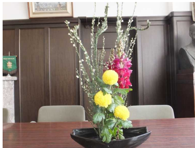
ピンポンマム・キンギョソウ・エニシダ

華道部の生徒が、部の活動日、校長室に生け花を持ってきてくれます。いつも来室されるお客様に誉めていただいています。ありがとうございます。年度が変わりましたので、番号をリセットします。