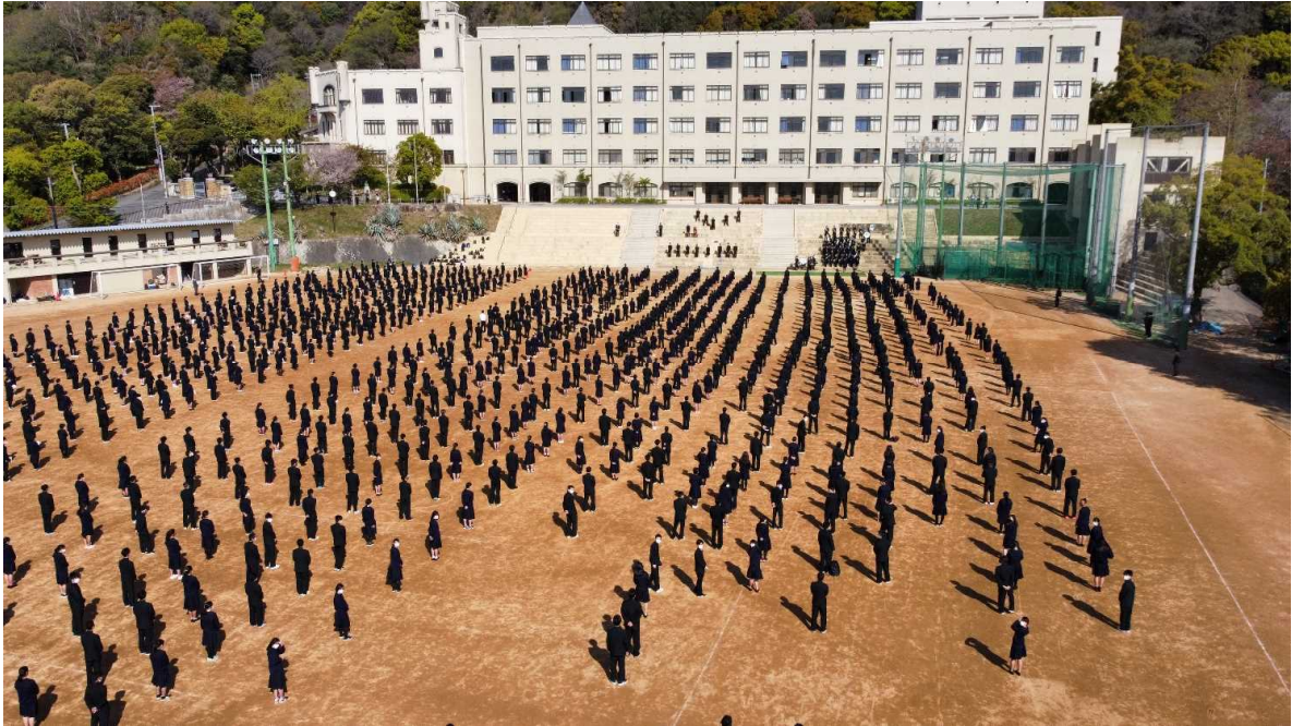
対面式（ドローンで撮影）

対面式では、校長・自治会長・新入生代表の挨拶、そして校歌並びにエールがありました。