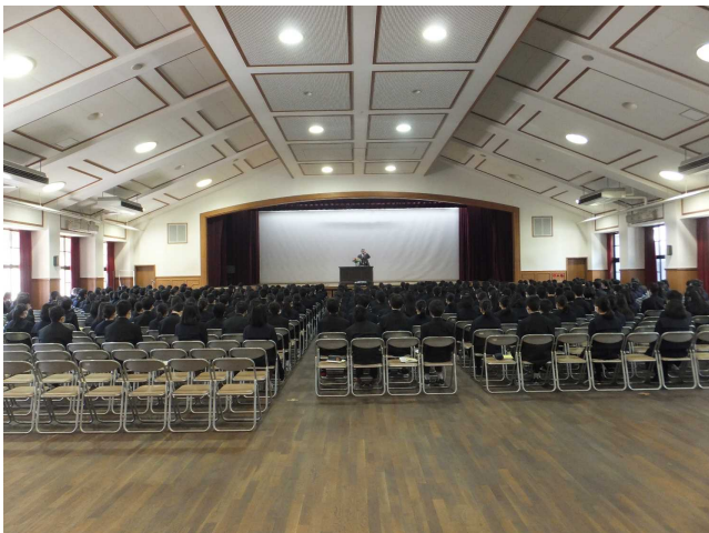
オリエンテーション（講堂）

オリエンテーションでは、講堂で勉強や部活動のこと、図書館のことなどの説明を聞きました。また、場所を第一運動場に移し、校歌の歌唱練習も行いました。