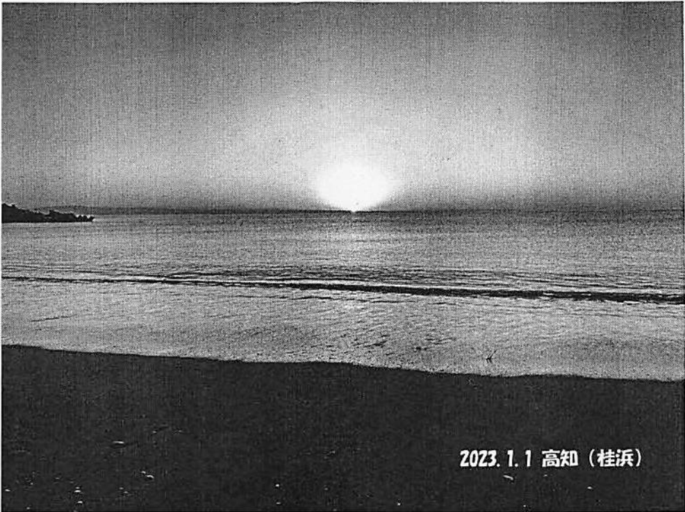
2023.1.1 高知 (桂浜)