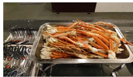
カニのメニューも