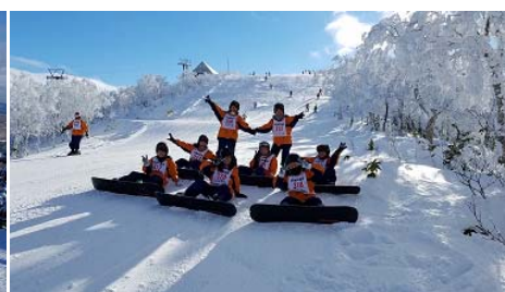
3日目は快晴の中での実習になりました