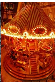
メリーゴーランド