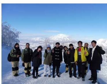
見学者もゴンドラで上がりました (後ろは羊蹄山)