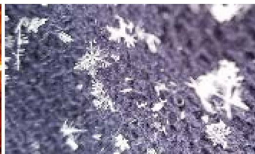
雪の結晶いくつか