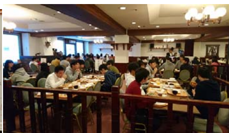
夕食(バイキング)の様子です