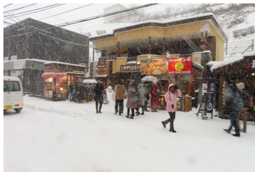
4日目(最終日):小樽散策 後半は雪の中での散策となりました

交通機関、天候、雪量すべてに恵まれ、事故、大きな怪我・病気もなく修学旅行を終えることができました。