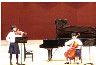
ヴァイオリンとチェロ