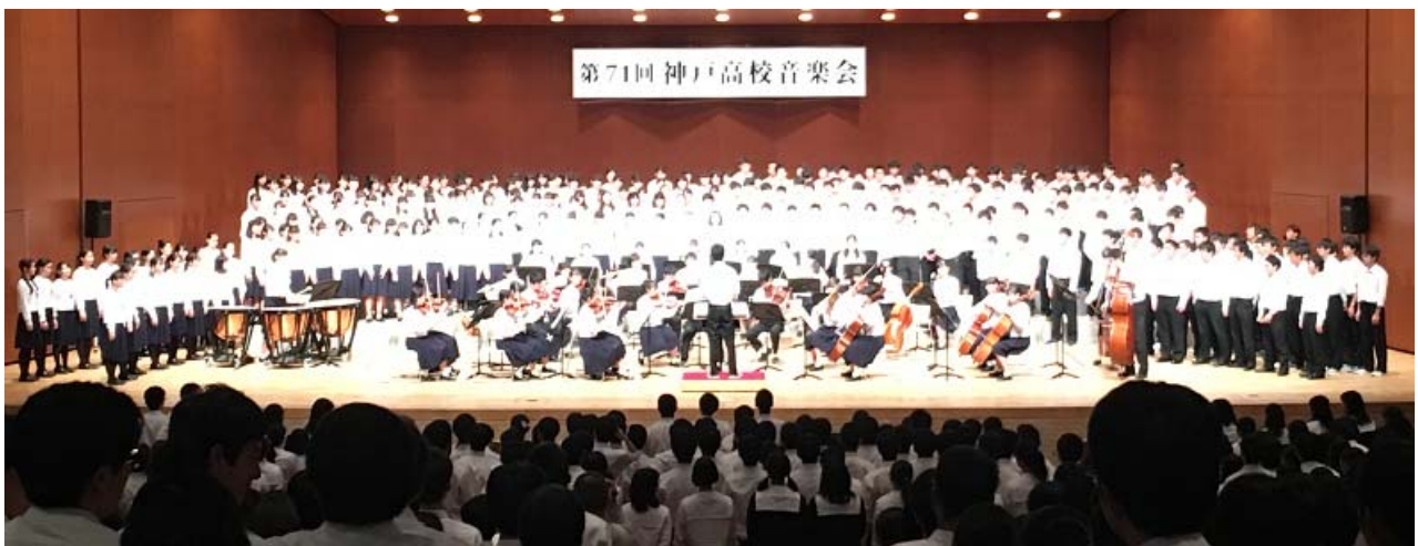
ハレルヤの大合唱から全員でサリマライズの合唱へ

ご尽力頂いた自治会、音楽関係部、生徒指導部はじめ、皆さんには心より感謝いたします。ありがとうございました。