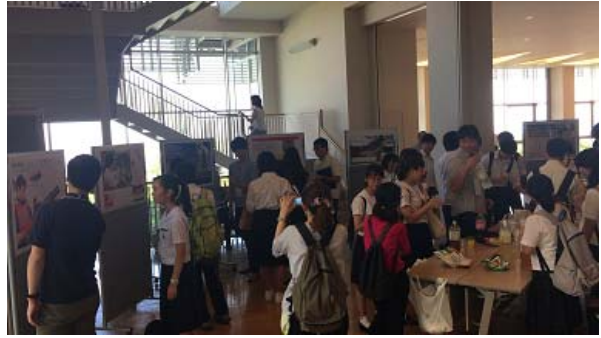
飲み物、お菓子もあり、リラックスしながら話ができます

総合理学部先生方や各校のALTの方、咲テク委員会の先生方、引率の先生方、関係の方々には準備から運営、また生徒の指導等々、大変ご尽力頂きました。本当にありがとうございました。