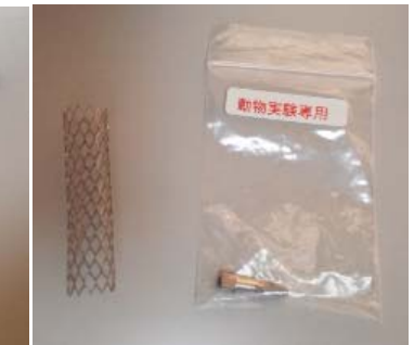
左:ステント 右:インプラント