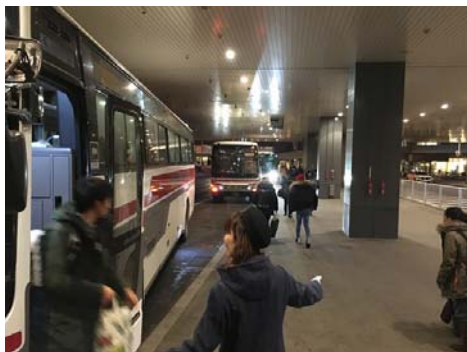
新千歳空港に着きました