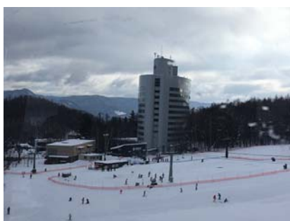
新富良野プリンスホテルです