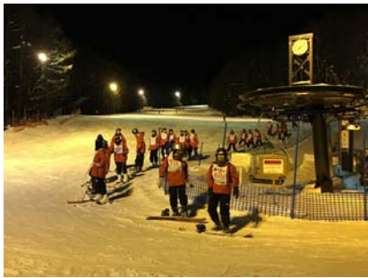
夕食後、希望者がナイターでのスキー、スノーボードを楽しみました。