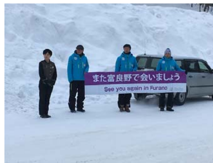
ホテルの方の見送りです