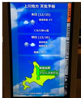
最終日の天気予報 (ホテルロビーのディスプレイ)

8:15 富良野発 11:30～15:10 小樽散策・昼食 16:30 新千歳空港着 17:50 新千歳空港発(ANA780) 20:30 伊丹空港着 21:30 王子公園着