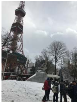
さっぽろテレビ塔を起点に班別散策です。(右は展望台からの景色)