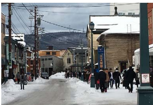
小樽の街並みです