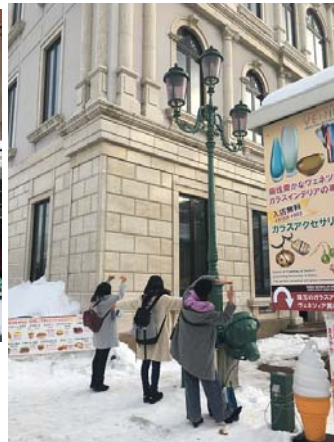
買い物の途中でちょっとポーズ