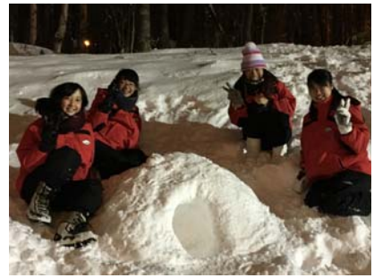
雪遊びでの“かまくら”です。