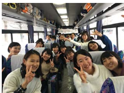
バスの中の様子です