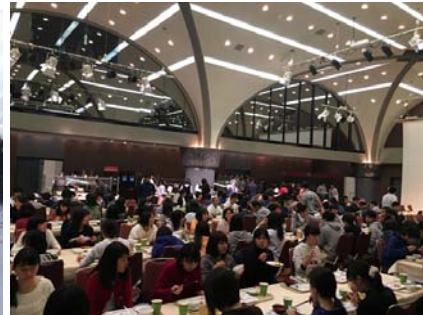
夕食(バイキング)の様子です