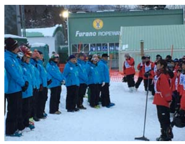
閉校式 (左) 修了書の授与 (右) お礼の言葉