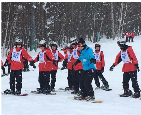
スノーボード実習です