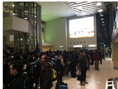
伊丹空港に無事到着。バス待ちです

交通機関、天候、雪量すべてに恵まれ、事故、大きな怪我・病気もなく修学旅行を終えることができました。