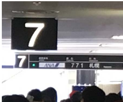
伊丹空港で搭乗待ちです