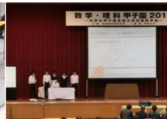
審査員の前でプレゼン