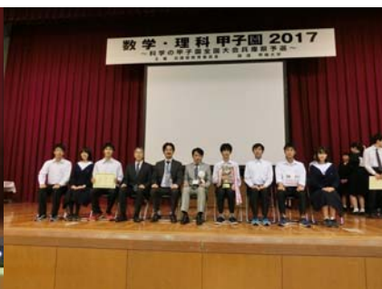
主催者と一緒に記念撮影