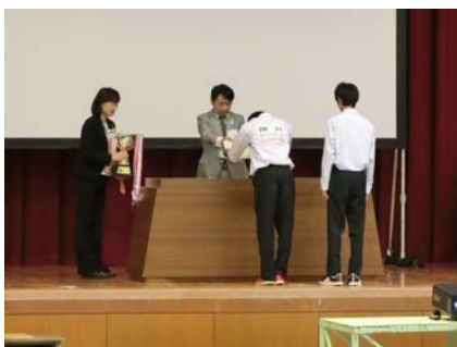
清瀬高校教育課長から表彰