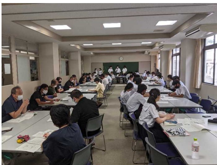
前で説明する自治会メンバー

皆さん、忙しい中、お疲れさまでした。 ※ フリートーキング 行事の実施等に向けて、自発的に参加した生徒と職員と一緒に自由に意見を出し合う、本校独特の意見交換会です。