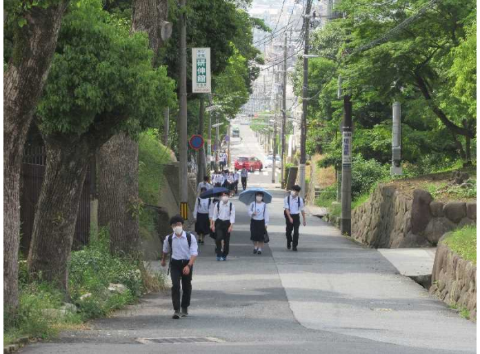
地獄坂のまばらな登校風景（9時すぎ）

久々の地獄坂は、外出を自粛していた生徒たちには少しきつく感じたようです。でも、心配はいりません。君たちならあっという間に元の状態を取り戻せますよ。